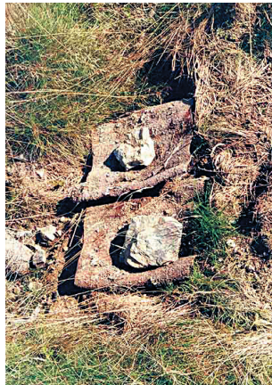
Fangrinden werden gefaltet und fixiert auf die Bekämpfungsfläche gelegt.

Beim Auslegen der Fangrinde wird zunächst die Bodenvegetation entfernt. Die Fangrinde wird in die dadurch entstehende kleine Mulde gelegt (geringere Austrocknung, Rüsselkäfer bewegen sich eher am Boden als im Gras) und mit einem Stein beschwert. Die Markierung der Auslegestelle mit einem Pflock ist zum Wiederfinden der Rinde im hohen Gras nötig. Die Fangrindenkontrolle sollte wöchentlich am besten in den Morgenstunden erfolgen, da bei kühlen Temperaturen die Käfer sehr langsam sind und daher leicht gesammelt werden können. Die gesammelten Käfer werden bekämpfungstechnisch behandelt. Die Begiftung der Fangrinden ist möglich.